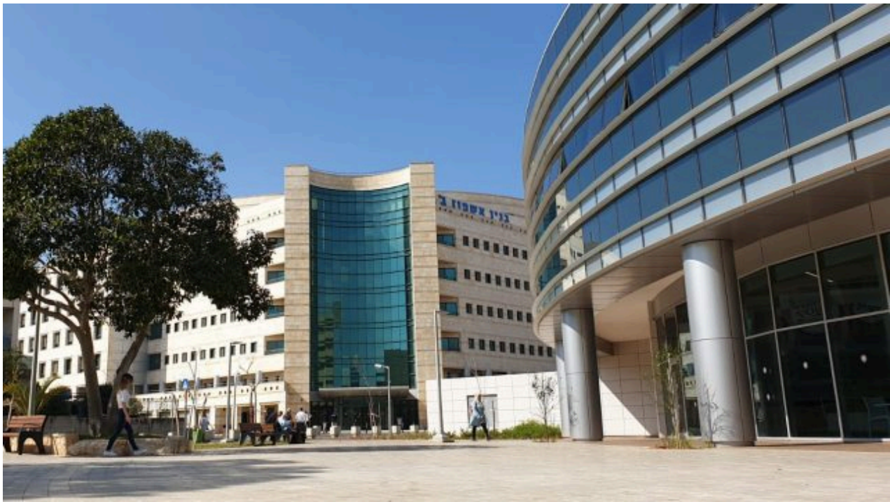
בית החולים הלל יפה בחדרה.

מערך הלב של המרכז הרפואי הלל יפה בחדרה, יחד עם מערך החדשנות והמחקר של המרכז, ובשיתוף מיזם כנרת של חטיבת בתי החולים הממשלתיים, זכה להיכלל במאגד בינלאומי בתחום מחלות הלב וכלי הדם במסגרת התכנית היוקרתית של האיחוד האירופאי Horizon Europe. שווי המענק בחלקו של "הלל יפה" - חצי מיליון יורו. בשבוע החולף התקיים המפגש הראשון להנעת המחקר.